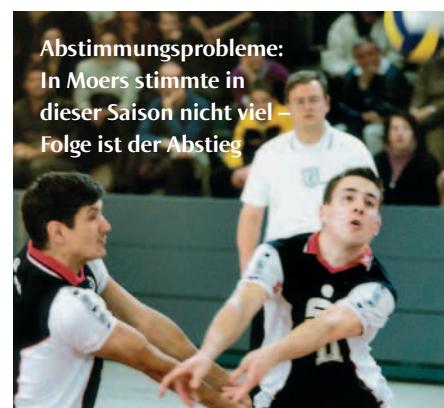
Abstimmungsprobleme: In Moers stimmte in dieser Saison nicht viel – Folge ist der Abstieg